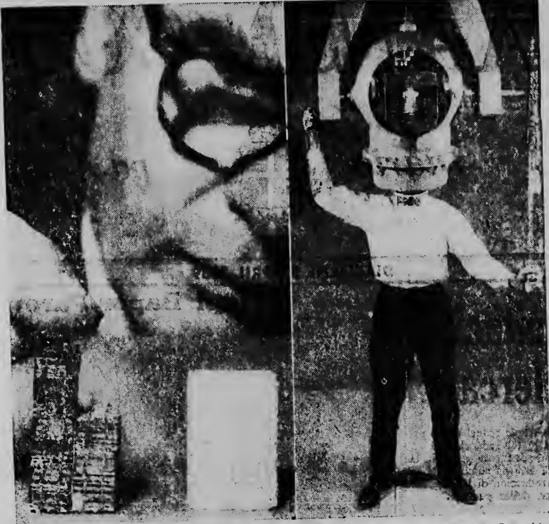
E programa di e Cuerpo di Senjal di Army Americano di micro-module na Fort Monmouth, New Jersey...